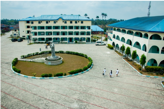
MADONNA UNIVERSITY TEACHING HOSPITAL COMPLEX

MUTH is a modern and well-equipped medical facility that provides quality healthcare services for the University community and the general public. It has a team of qualified and experienced doctors, nurses, and other health professionals who offer a comprehensive range of services, such as consultation, diagnosis, treatment, surgery, laboratory, pharmacy, radiology, and physiotherapy. MUTH is also equipped with a modern accident and emergency unit to cater to urgent medical needs. The hospital is committed to providing holistic care to patients.