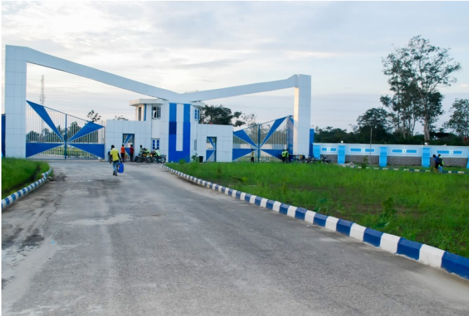
MADONNA UNIVERSITY ENTRANCE