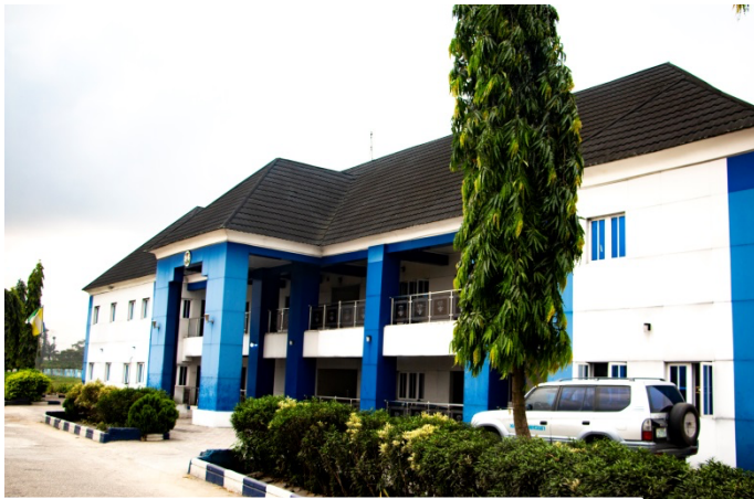
MADONNA UNIVERSITY OFFICE COMPLEX

Nous sommes ravis de vous accueillir à Madonna University et nous sommes convaincus qu'il s'agira d'un événement stimulant et productif.