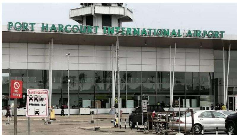
PORT HARCOURT INTERNATIONAL AIRPORT

Several international airlines fly to Port Harcourt International Airport (PHC) from different parts of the world. Some of the popular international airlines that operate flights to PHC Airport include: