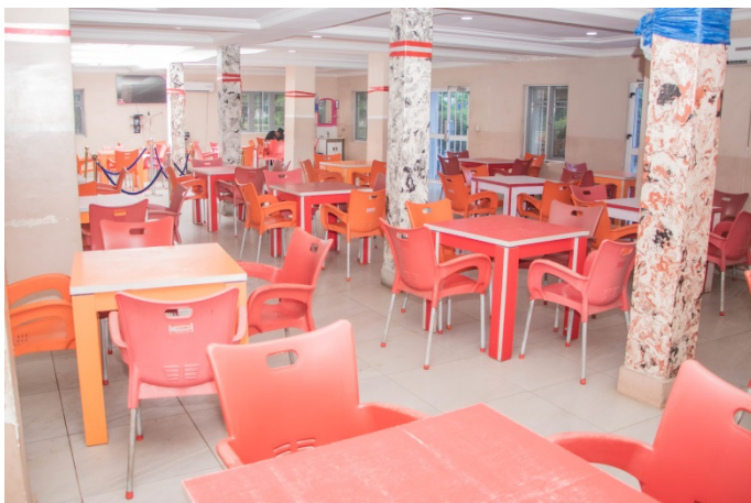
MADONNA UNIVERSITY REFECTORY

The refectory is a spacious and hygienic dining hall that serves delicious and nutritious meals for the University community. It offers a variety of dishes, including local and continental cuisines.