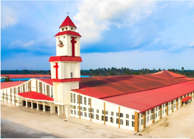
CHURCH OF JESUS THE SAVIOUR

The International Sanctuary of Jesus the Saviour and Mother Mary is a Catholic pilgrimage site located in Elele, Rivers State, Nigeria. The Sanctuary is dedicated to Jesus the Saviour and Mother Mary. It is known as a home of effective intercession for both Catholics and non-Catholics from all over the world.