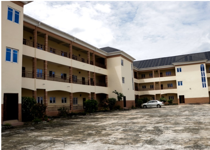
MADONNA UNIVERSITY GUEST HOUSE

Madonna University offers comfortable accommodations for guests who lodge in the University campus. The guest house has well-furnished rooms with air conditioning, internet access, and other modern amenities.